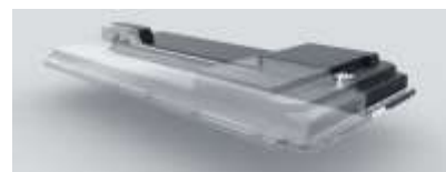
Batería Blade híbrida ultrasegura