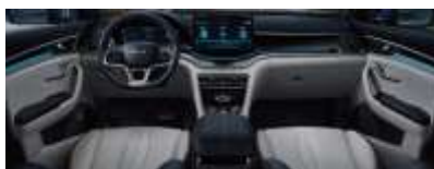
Cabina inteligente y cómoda