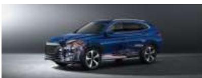
Sistema híbrido eléctrico revolucionario